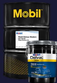
Mobil Delvac™ Modern 15W-40 Súper Protección. API CK-4

Se ha demostrado que los lubricantes de motor Mobil Delvac™ ayudan a: