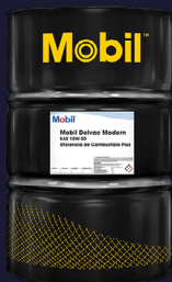
Mobil Delvac™ Modern 10W-30 Eficiencia de Combustible Plus. API FA-4

2 VECES MÁS OEM IDA +Eficiencia de combustible*