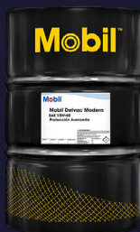
Mobil Delvac™ Modern 15W-40 Protección Avanzada. API CK-4